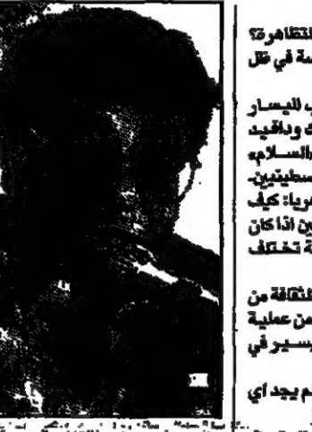
محمود درويش